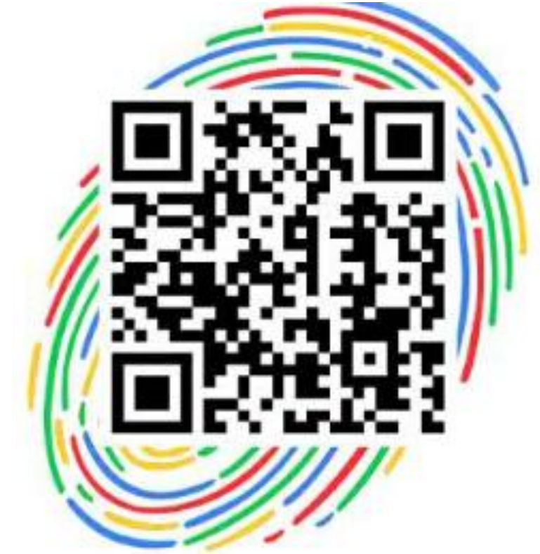
北大汇丰MBA微博公众号