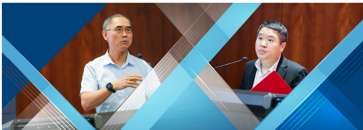
▲微众银行首席人工智能官杨强教授演讲（左）北京大学汇丰商学院副院长王鹏飞教授致辞（右）