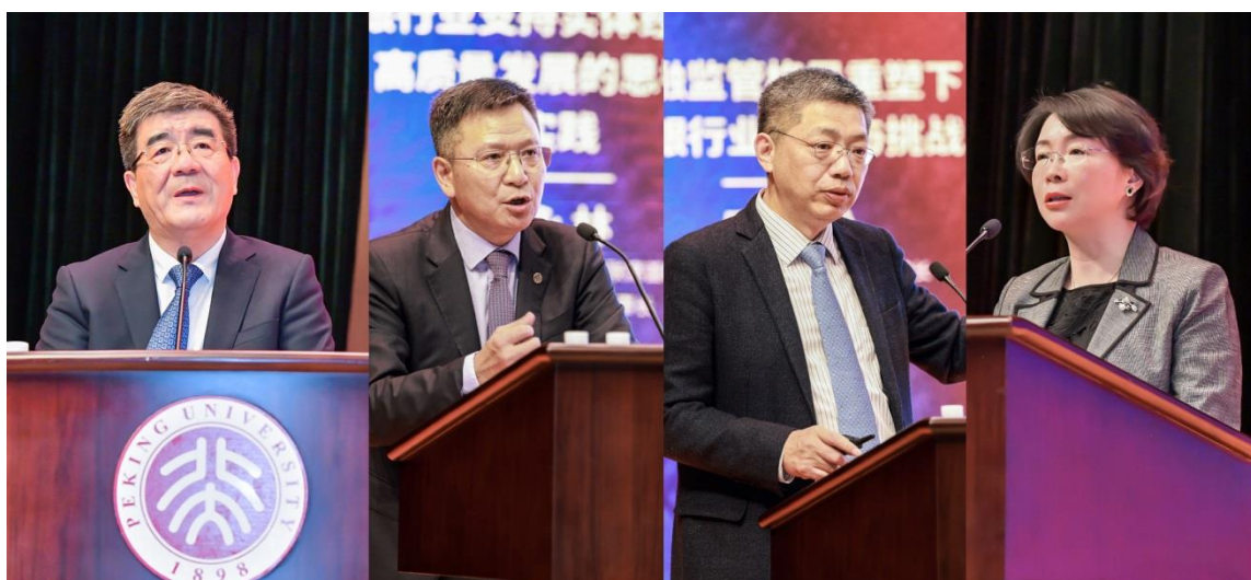
▲开幕致辞及主旨演讲（左起）：海闻、谢永林、巴曙松、王晏蓉

3月18日，由北京大学汇丰金融研究院主办的“北大汇丰金融论坛”在深圳大学城国际会议中心隆重举行，著名学者、行业翘楚共700余人参会。